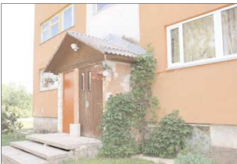
Konkursil "Kaunis Eesti kodu 2007" autasustati mastivimpliga korteriühistut Tilsi Koda Tilsi külas.