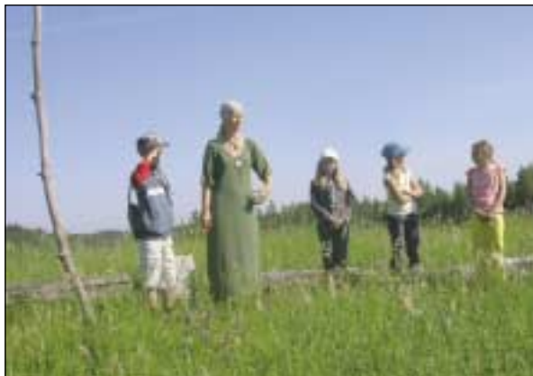
Vana - Koiola kool soovib oma praegustele ja tulevastele õpilastele, lapsevanematele ning kõigile headele sõpradele ilusat suve. Kohtume taas uue õppeaasta avaaktusel 3.septembril kell 10.